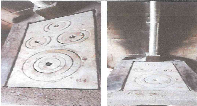
Foto 3: Filización de chimenea y colocacion de planchan nueva área cocina