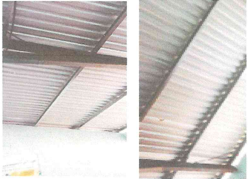
Foto1: Se encuentra realizado el cambio de techo de dos aulas de la escuela de la EORM Comunidad San Jose La Montaña